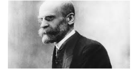
Emile Durkheim (1858-1917)