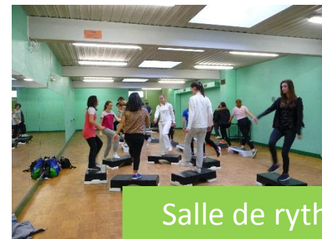
Salle de rythme